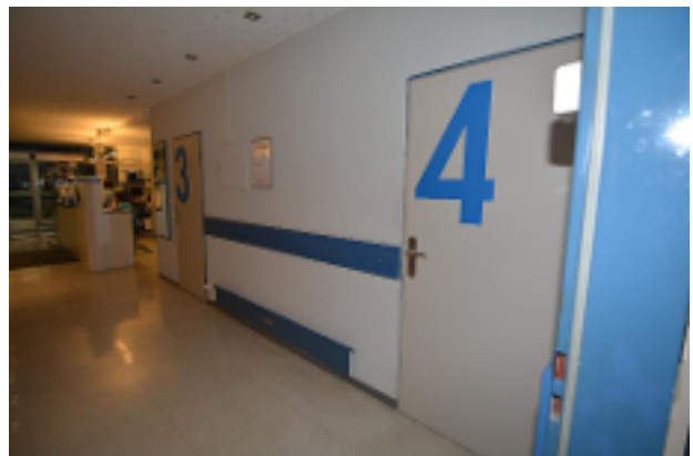
Anmeldung und Sprechzimmer