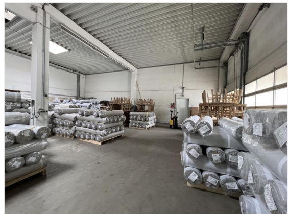
Innenansicht Halle Seiteneingang