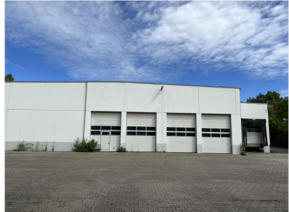
Lagerhalle - Ansicht mit Rampen.